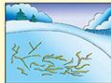
Места, где в лёд вмерзли водоросли