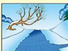
Места, где летом бывает быстрое течение, бьют ключи или впадает другая речка или ручей