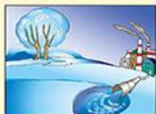
Рядом со сбросом сточных вод