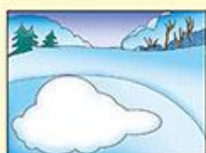
Места, где на льду много снега