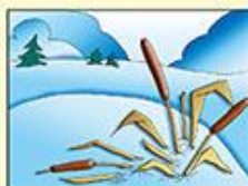
Около кустов и камыша