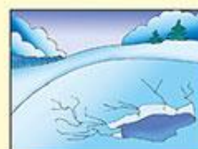
Около трещин и разломов льда у берега